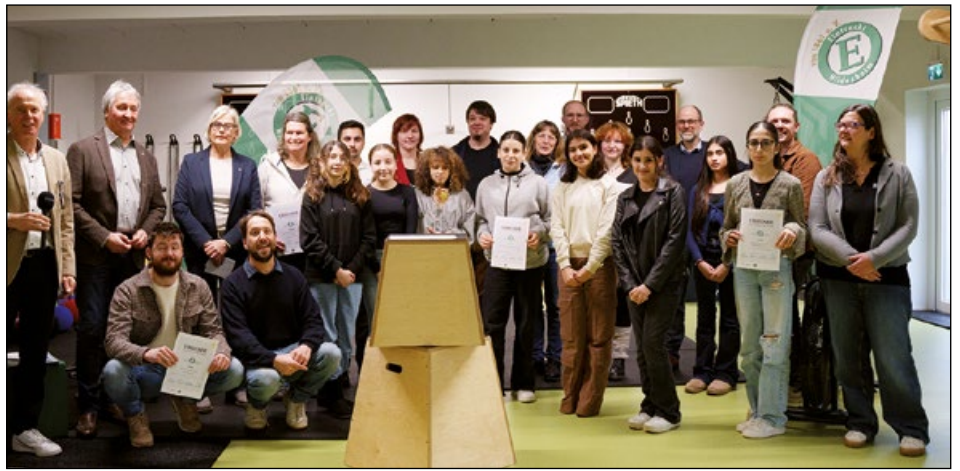
Sie alle bekamen einen Guy-Stern-Preis.

Der erste Platz ging an die Realschule Himmelsthür für ihr beeindruckendes Projekt „Gegen das Vergessen. Für den Frieden. – Eine Lichtinstallation zur Erinnerung an Guy Stern“. Die Jury lobte insbesondere die kreative und tiefgründige Auseinandersetzung mit der Erinnerungskultur und das herausragende Engagement der Schüler. Die Preisverleihung bot den Teilnehmern