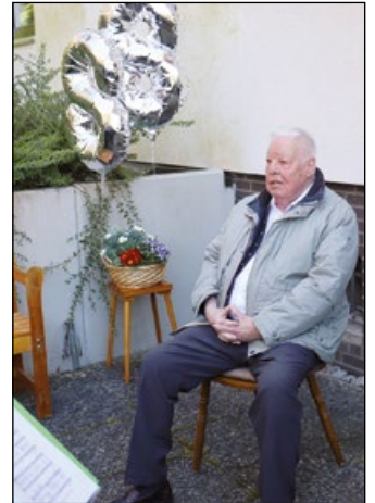
Der Jubilar lauscht dem Ständchen seiner Sangesbrüder.