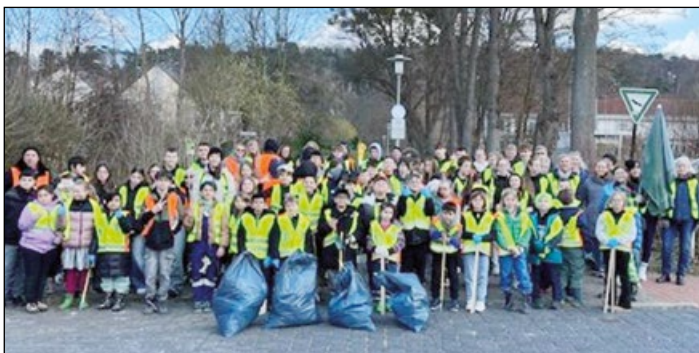
Wieder rekordverdächtig: Landesbildungszentrum für Hörgeschädigte – die größte Beute: ein Sonnenschirm und ein Bürostuhl

(bc) Am 15. März und in den Tagen davor machten sich viele fleißige Müllsammler und Müllsammlerinnen im Stadtteil Marienburger Höhe/Galgenberg auf den Weg und suchten am Straßenrand, auf Plätzen, Wegen (und im Gebüsch) nach dem, was unachtsame Mitmenschen einfach weggeworfen und damit der Allgemeinheit zum Aufräumen überlassen hatten (oder der Stadt auf Kosten der Steuerzahler).