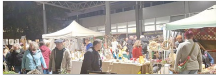
Bis in die Abendstunden herrschte 2024 eine lockere und einladende Atmosphäre.