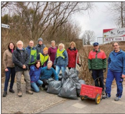
Alle Jahre dabei: die fleißige Truppe vom MTV