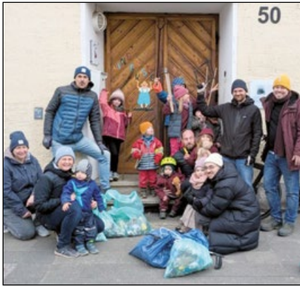
Früh übt sich – die großen und kleinen Sammler und Sammlerinnen von der Kinderkiste