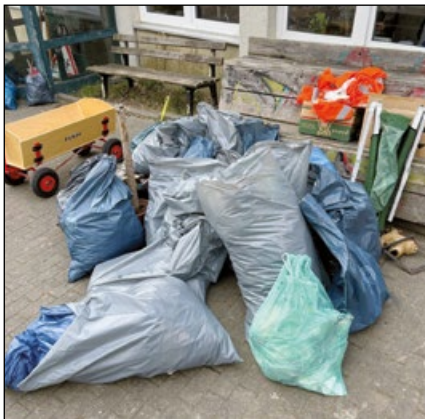
Die letzten Müllbeutel warten auf die Abholung