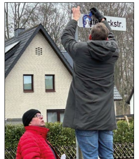
Ganz schön mühsam, Aufkleber von Straßenschildern abzukratzen (wo sie nicht hingehören)