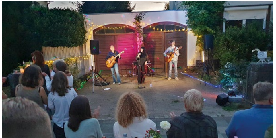
Beispiele auch eine der Seebühnen während der Hildesheimer Wallungen: die beliebte, einheimische Band „Candy Moon“.