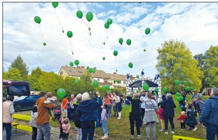
Welcher fliegt wohl am weitesten? Der Luftballonwettbewerb macht den Kindern viel Spaß

(bc) Gleich zu Beginn des Festes am 23. August kam ein feuchter Gruß vom Himmel, und später am Nachmittag pladderte ein kräftiger Regenguss herunter, bevor Petrus ein Einsehen hatte und den Feiernden das erhoffte schöne Wetter bescherte, einen blauen Himmel mit ein paar Wolken und angenehmen Temperaturen.