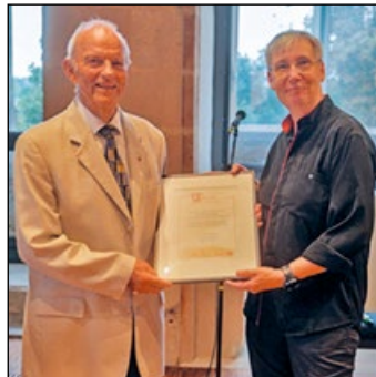
Übergabe der Ernennungsurkunde