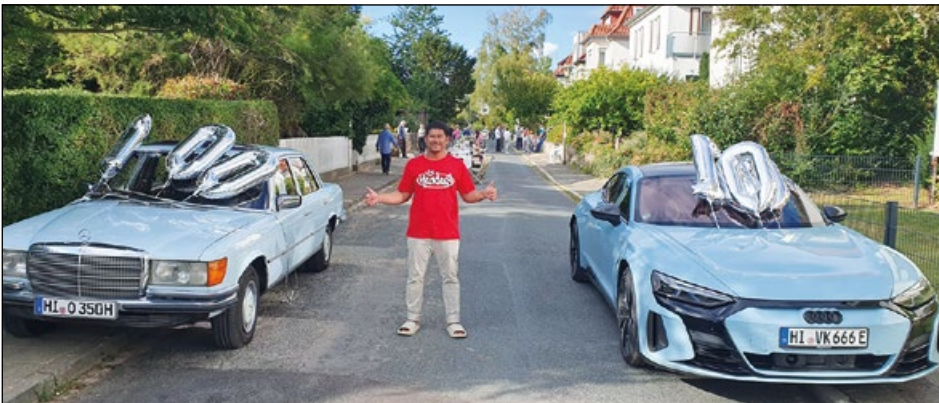
2 x Himmelblau: Ein Mercedes-Oldtimer und moderne Etron-Technik markierten kontrastreich den südlichen Zugang zum Straßenfest.

Den Auftakt bildete quasi der schon frühmorgens „auf der Acht“ unterhalb des Krieger-Denkmal beginnende „Enzo-Flohmarkt“. Gegen Mittag öffnete eine einzige Regenwolke kurz ihre Schleusen, wenig später schon begann der Aufbau des Straßenfest-Mobiliars zwischen den Häu-