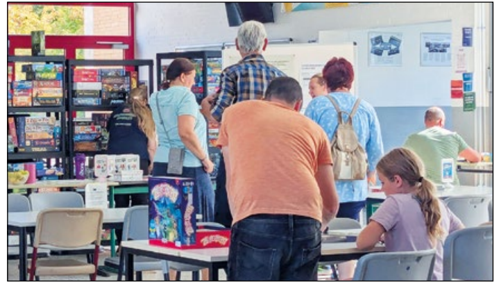
Spieltisch in der Aula