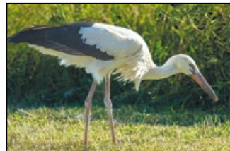
Frische Wiesen, Tümpel und Gräben bieten dem Storch alles, was er braucht

Die große Aufmerksamkeit für den Storch ist erfreulich, denn mit seinem schwarzweißen Gefieder, mit dem langen roten Schnabel und