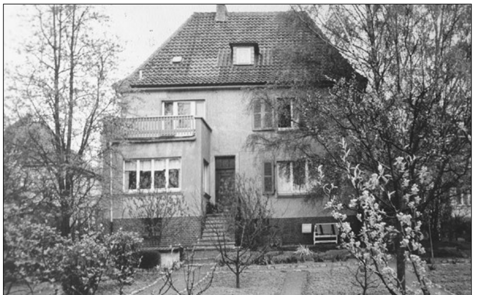
Ein aussagekräftiges Beispiel aus dem ehemaligen „Lehrer-Viertel“: Die Sebastian-Bach-Str. 10 mit dem seinerzeit typischen Nutzgarten.