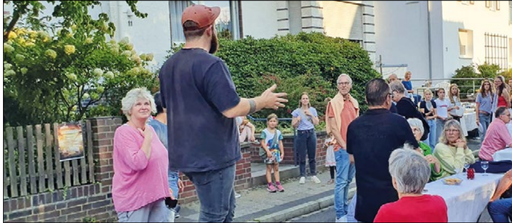
Ein Straßenzug als Festtags-Meile – mit massenhaft gut gelaunten Bewohnern und Besuchern