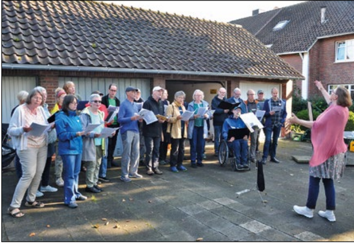
Sie sind mit ansteckender Freude dabei – die Sänger und Sängerinnen des Straßenchors

(bc) Am 23. August feierten Anwohner und Anwohnerinnen an der Ecke von Schillstraße und Halberstädter Straße ihr sommerliches Straßenfest. Diesmal gab es einen ordentlichen Segen von oben dazu, aber nachdem der Regen abgezogen war, wurde es richtig schön – wie seit über 20 Jahren.