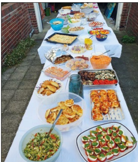
Nur ein kleiner Ausschnitt: Das kunterbunt bestückte „Mitbring-Büfett“ repräsentierte Kochkünste aus mehreren Dutzend Haushalten.