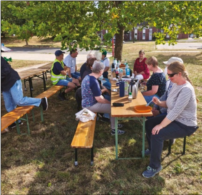
Premiere vor dem Bürgerhaus: das erste Itzumer Stadtteil-Café

(r) Was gibt es Schöneres, als an einem lauen Sommernachmittag mit netten Menschen zusammen an der Kaffeetafel zu sitzen? Das Itzumer Stadtteil-Café hat am 30. August den Beweis angetreten: Da geht noch mehr.