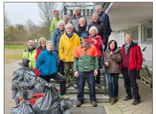
Alle Jahre dabei: die fleißige Truppe vom MTV