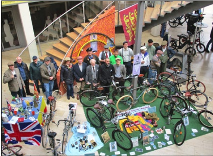
Hi-stoVelo-Team und Stand mit Blicken in die Geschichte rund ums Fahrrad und Orbitalrad im Hintergrund

(tom) Die 35. Radmesse, die am 15. März in der Andreaspassage stattfand, bot alles rund ums Fahrrad. Auch die Radwegeentwicklung auf der Marienburger Höhe war ein umfassendes Thema. Die Palette ausgestelltter Vehikel reichte von antiken Rädern aus der Jahrhundertwende bis in die Moderne. Die Veranstaltung präsentierte ein Spektrum aus rund 130 Jahren rädrieger Zeitgeschichte.