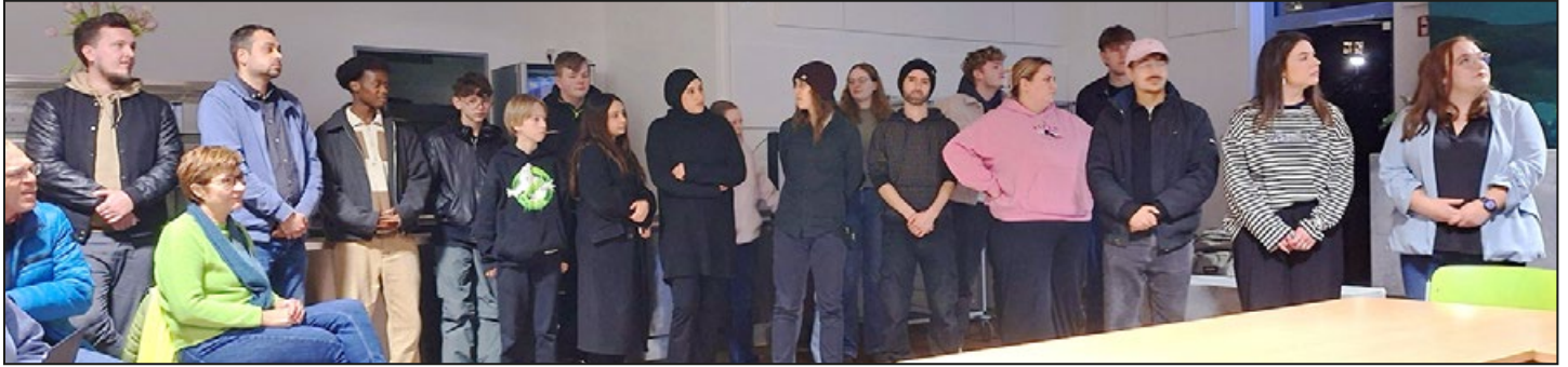
„Jugendbewegung“ im Ortsrat

(ren) Die Jugend stand im Mittelpunkt der Februarsitzung des Ortsrats Marienburger Höhe/Galgenberg. Schülerinnen und Schüler des achten Jahrgangs der Oskar-Schindler-Schule hatten mit dieser Frage den Stadtteil durchstreift. Ihre Ergebnisse trugen sie dem Ortsrat und seinen Besucherinnen und Besuchern vor.