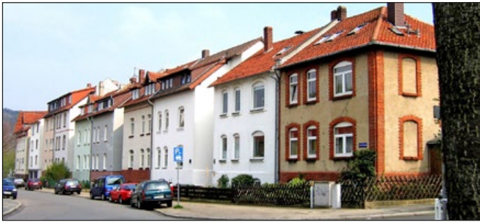
Fast wie früher – Klemmbutz heute: ein Blick in die Schillstraße

(or) Ein heute 91-jähriger hat seine Jugendzeit auf dem Klemmbutz noch vor Augen. Es war zu einem Zeitpunkt, wo der sogenannte Klemmbutz oder auch Feldherrnhügel, weit vor der alten Stadtgrenze, noch von Garten- und Ackerland umgeben war.