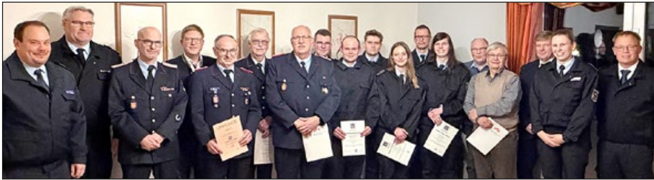
Die beförderten und geehrten Feuerwehrleute auf einem Blick