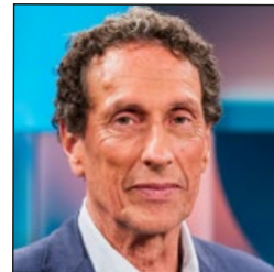
Dr. Julian Nida-Rümelin

Am Mittwoch, 15. April, 19 Uhr, liest Bestsellerautor und Fernsehmoderator Michel Abdollahi aus „Es ist unser Land ...“ Rechtes Gedankengut, das salonfähig geworden ist, eine heillos zerstrittene bürgerliche Mitte – Michel Abdollahi geht dahin, wo es wehtut und benennt Missstände deutlich und pointiert. Zugleich zeigt er auf, wie eine Wende gelingen kann, hin zu einem friedvollen und vielfältigen