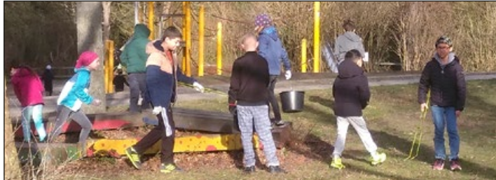
Mit Elan dabei – die Grundschule auf der Höhe

(bc) Am 14. und 21. März und in den Tagen davor machten sich viele fleißige Müllsammler und Müllsammlerinnen im Stadtteil Marienburger Höhe/Galgenberg auf den Weg und suchten am Straßenrand, auf Plätzen, Wegen (und im Gebüsch) nach dem, was unachtsame Mitmenschen einfach weggeworfen und damit der Allgemeinheit zum Aufräumen überlassen hatten (oder der Stadt auf Kosten der Steuerzahler).