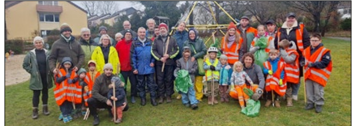
In den Startlöchern: gleicht geht es los!