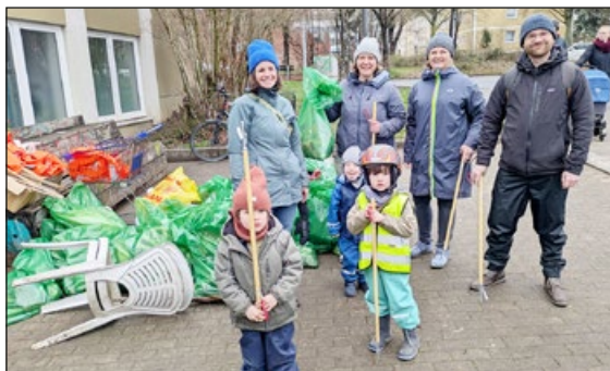
Früh übt sich – die großen und kleinen Sammler und Sammlerinnen von der Kinderkiste