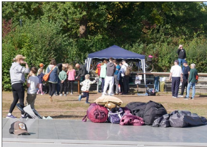
Beim Sportabzeichenerwerb können alle mitmachen

Wer als Gruppe das Sportabzeichen erfüllen möchte, kann einen zusätzlichen Termine über die Geschäftsstelle, Tel.-Nr. 05121 12674, vereinbaren.