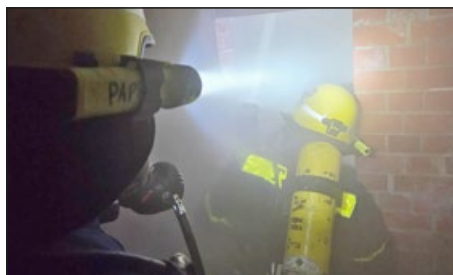
THW-Atemschutzgeräteträger üben unter einsatznahen Bedingungen

Auf dem dortigen THW-eigenen Übungsgelände wurden neue Atemschutzgeräteträger ausgebildet. Die Einsatzkräfte trainierten auf der Atemschutzübungsstrecke und später unter realen Bedingungen in vernebelten Tunnelgängen und Trümmer-